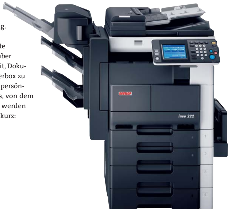
ineo 222 mit eingebautem Finisher (FS-530), Heft- und Rücksticheinheit (SD-507), Papierkassette (PC-206) und Originaleinzug (DF-620)

Mit der Funktion Scan-to-E-Mail lassen sich gescannte Dokumente an eine E-Mail-Adresse versenden. Darüber hinaus haben Nutzer bei der ineo 222 die Möglichkeit, Dokumente auf eine optionale passwortgeschützte, Nutzerbox zu scannen und sie zu speichern. Die Nutzerbox ist ein persönlicher Speicherplatz auf der Festplatte des Systems, von dem die Daten ständig abgerufen und erneut gedruckt werden können. Das verkürzt die Wege und spart viel Zeit – kurz: Es optimiert die Arbeitsprozesse.